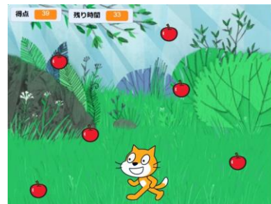
リンゴ・キャッチ・ゲームの画面

ゲームのプログラミングは初めての児童が多く、興味を持ってプログラミングしていた。