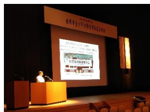
橿原市少年指導委員協議会 会場:かしはら万葉ホール

令和5年度から、学校が申込時に講師の団体を指名する制度に変更された。このため、県の募集開始前に開講実績のある学校を中心に DM 送付の営業活動を行った。飛鳥未来高校からは、「e-AAC の HP が本校の考えにマッチしている。」との理由で、指定を受けた。