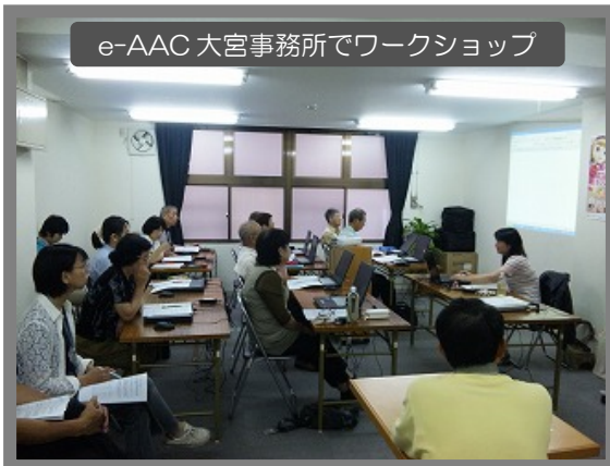
e-AAC 大宮事務所でワークショップ