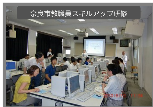
奈良市教職員スキルアップ研修