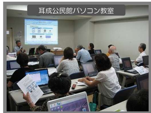
耳成公民館パソコン教室