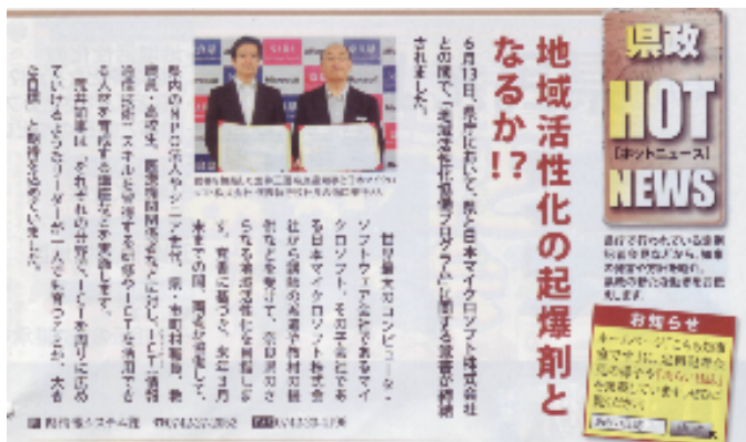
(県民だより奈良8月号より)